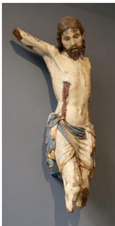
Giovanni Tedesco. „Kreuzifix Fragment“ 1462. Bode Museum Berlin.

zuweilen hinter dem zurückbleibe, was ich als richtig und wahr erkannt habe, schuldig werde.