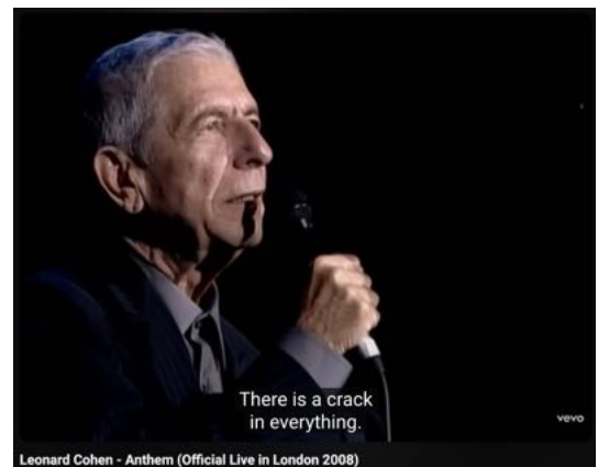
Leonard Cohen - Anthem (Official Live in London 2008) https://youtu.be/c8-BT6y_wYg?si=mss9-cAJ33hYqgHl

Vermutlich kennen Sie alle Leonhard Cohen. Der jüdische Poet und Sänger ist vor nicht ganz 10 Jahren gestorben. Licht, das die Dunkelheit durchbricht, ihr nicht den ganzen Raum überlässt, war ein Thema für ihn. »Anthem« heißt eines seiner Lieder. Christliche und jüdische Gedanken kommen in ihm zusammen. Anthem – Hymne. Der Kehrsvers ist prägnant: »Es gibt einen Riss in allem. So kommt das Licht herein.«