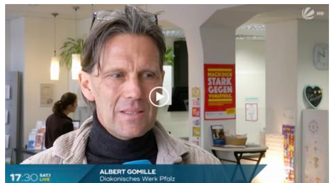
Einen guten Einblick in die Arbeit liefert der Bericht des Sat.1 Regionalmagazins 17:30 Live aus dem Jahr 2023!

Entscheidend ist, dass ich hinhöre – auf die Menschen und auf Gott. Ich komme nicht mit fertigen Geschichten zu den Leuten, sondern gucke und höre mir die Geschichten an, mit denen die Leute kommen. Wenn ich zu früh einen Plan vorgebe, dann verpasse ich vielleicht das, was gerade dran ist!