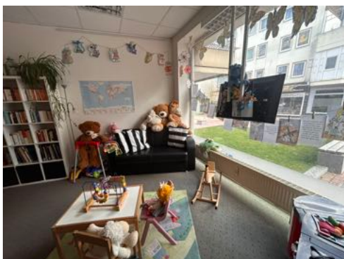
Kinder gehören im Mittendrin dazu und werden in der einladenden Spielecke betreut.

Wir verabschieden uns vom Mittendrin mit dem guten Gefühl: Hier ist wirklich jeder und jede willkommen, hier wird eine Kultur der Würde und der Nächstenliebe gepflegt – und wir können jedem nur empfehlen: Einfach mal